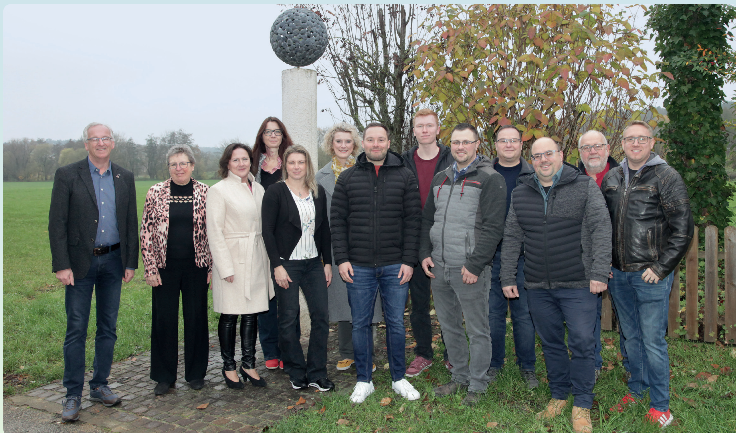
Am Igensdorfer Planetenweg.

Wir sind 15 engagierte Frauen und Männer aus unterschiedlichsten Berufen und Altersgruppen und aus dem ganzen Gemeindegebiet. Im Marktgemeinderat wollen wir unsere Ortsteile sowie den ganzen Markt Igensdorf voranbringen. Nutzen Sie Ihre 20 Stimmen am 8. März für Augenmaß und Sachverstand – mit bis zu drei persönlichen Stimmen pro Kandidatin / Kandidat oder einem „Listenkreuz“ für das Igensdorfer Umland!